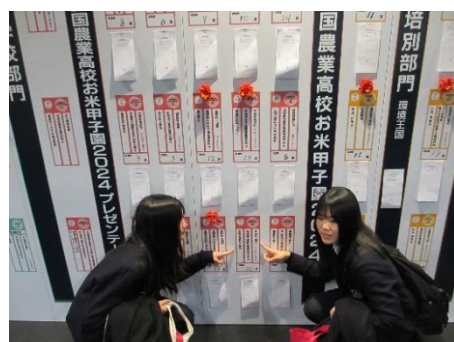
本校産コシヒカリ BL への投票数