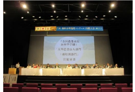
審査員の方々の食味官能検査風景