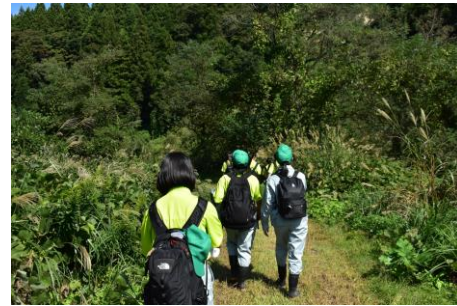
<妙高高原駅から演習林まで 徒歩で移動します>